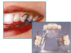
Klammerprothese - einfache Lösung bei fehlenden Zähnen

Kombinierter Zahnersatz ohne Klammern bietet einen hohen Tragekomfort, mehr Sicherheit und eine sehr ansprechende Ästhetik. Welcher kombinierte Zahnersatz, und welche Verbindungselemente die optimale Lösung sind, muss im Einzelfall - je nach Gebiss-Situation - entschieden werden.