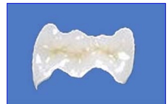
Präzises Keramik-Inlay im zahntechnischen Labor hergestellt.

Keramik-Inlays im Seitenzahnbereich sind eine bewährte, ästhetische und körperverträgliche Lösung. Sie werden in Form und Farbe dem natürlichen Zahn nachgebildet. Selbst die Kaufläche wird mit viel Detailarbeit individuell gestaltet, damit die optimale Kaufunktion dauerhaft sichergestellt ist.