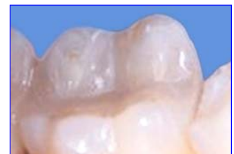
Keramik-Inlay eingesetzt - als Zahnfüllung nicht erkennbar.

Das Keramik-Inlay ist eine Präzisionsarbeit vom Zahnarzt und Zahntechniker. Jedes Keramik-Inlay ist zugleich ein Unikat. Die individuellen Zahnfarben und die präzisen Verarbeitungsmöglichkeiten machen es im Mund praktisch unsichtbar. Mit dieser Ästhetik ist ein Vollkeramik-Inlay geradezu prädestiniert für eine Versorgung im sichtbaren Bereich der Zähne.