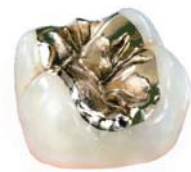
Präzises Gold-Inlay im zahntechnischen Labor hergestellt.

Gold-Inlays im Seitenzahnbereich sind eine bewährte, langlebige und körperverträgliche Lösung. Gold-Inlays werden dem natürlichen Zahn nachgebildet. Selbst die Kaufläche wird mit viel Detailarbeit individuell gestaltet, damit die optimale Kaufunktion dauerhaft sichergestellt ist. Das Gold-Inlay ist eine Präzisionsarbeit vom Zahnarzt und Zahntechniker.