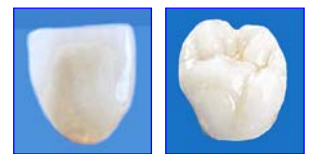
Frontzahnkrone und Seitenzahnkrone aus Keramik – dem natürlichen Zahn nachgebildet und metallfrei.